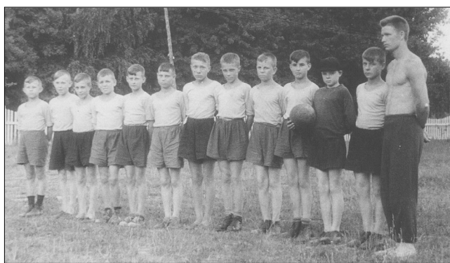
1961 год. Детская команда рамонского «Торпедо» на тренировочных сборах в пионерлагере

Только «Дворец» и наша юго-западная Первомайская улица не имели своих фирменных полей, поэтому играли где придется: на самой улице и в тенистой лесополосе за огородами (теперь полностью вырубленной и застроенной - прим.