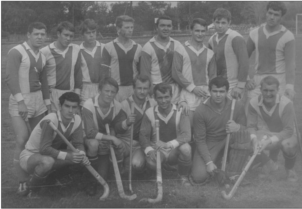
1969 год. Воронежская команда «Буревестник» - участник первого первенства СССР по хоккею на траве

Показательно, что 90 процентов мячей, забитых на турнире, были посланы в ворота с правой (удобной) для игрока стороны. Проанализи-