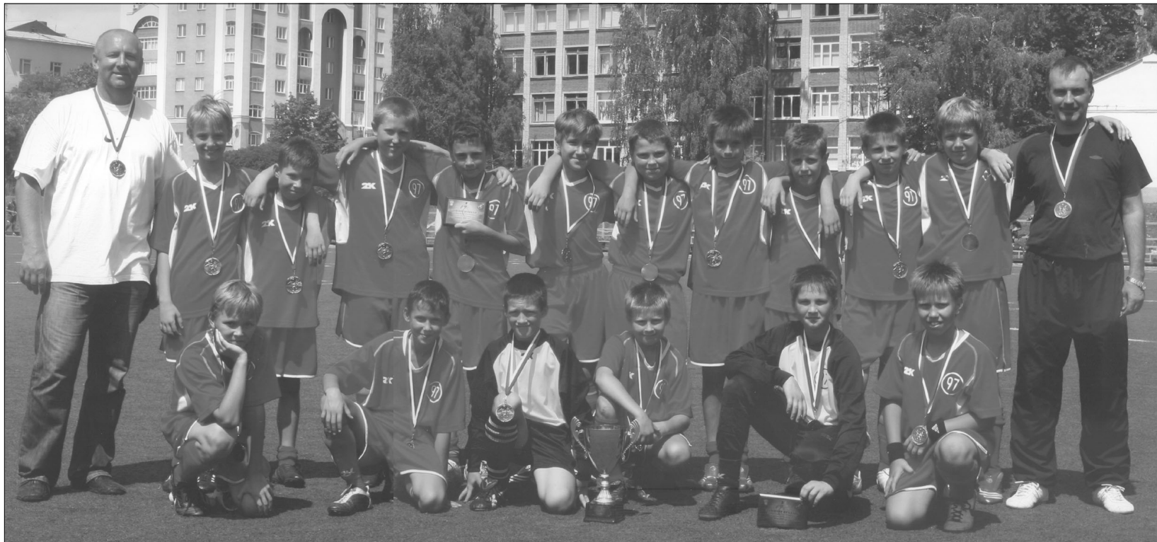
Команда юношей 1997 г.р. воронежской СДЮСШОР - чемпион первенства МОА «Черноземье» 2009 года

- Абсолютно верно. Я сторонник новых футбольных веяний.