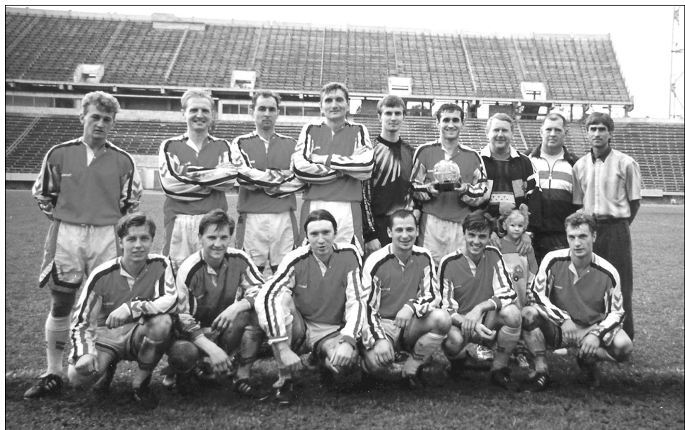
Футболисты и тренеры воронежского «Рудгормаша» на главной арене города