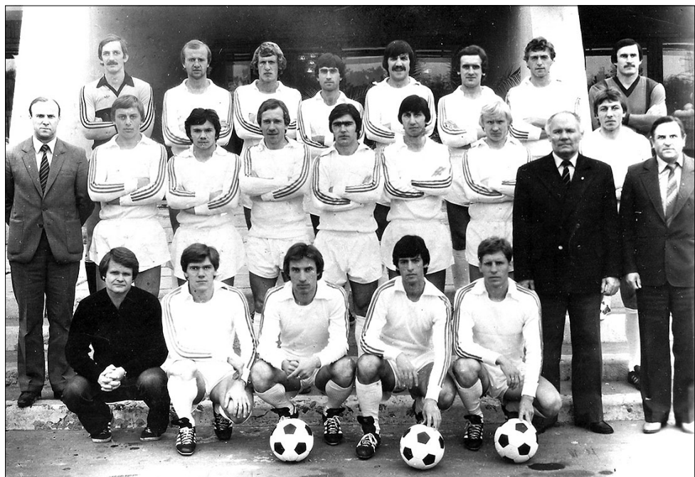
1983 год. «Факел» на своей базе в поселке Тенистый

Воронежский «Буран» (2-я лига первенства СССР, 1990-91) - второй тренер. «Престиж» (Воронеж, чемпионат области) - старший тренер. «Локомотив» (Лиски, 1995-97, 1999) - второй тренер, и.о. главного тренера. Работал с детскими командами.