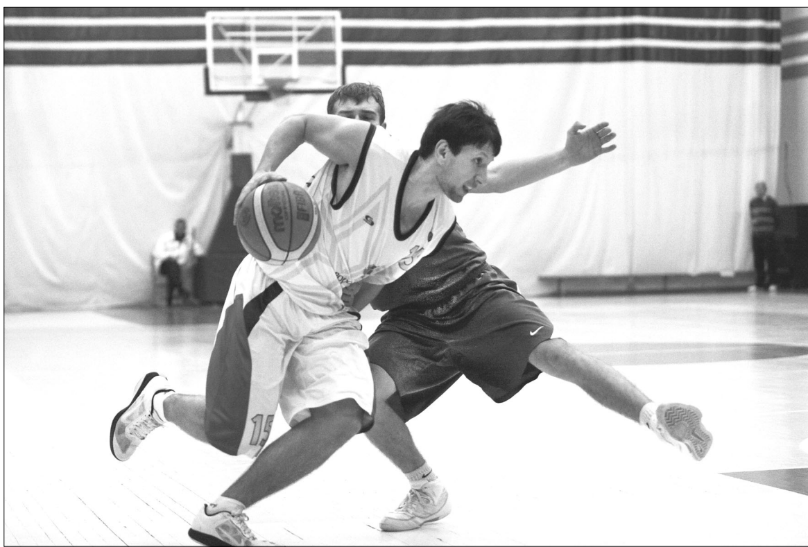
«Согдиане-СКИФ» будет непросто пробиться в квартет сильнейших команд высшей лиги

- Это, конечно же, будет определенным образом негативно влиять на ребят. Но думаю, что несильно: все-таки не такая уж это и большая разница. Можно было бы подстраховаться и отправиться на Алтай пораньше, дабы адаптироваться к смене часовых поясов, но... Поймите, наш клуб не столь богат, чтобы позволить себе таким вот образом транжирить деньги - надо жить по средствам. Впрочем, все наши соперники тоже находятся в таком же положении - все команды из Европейской части Рос-