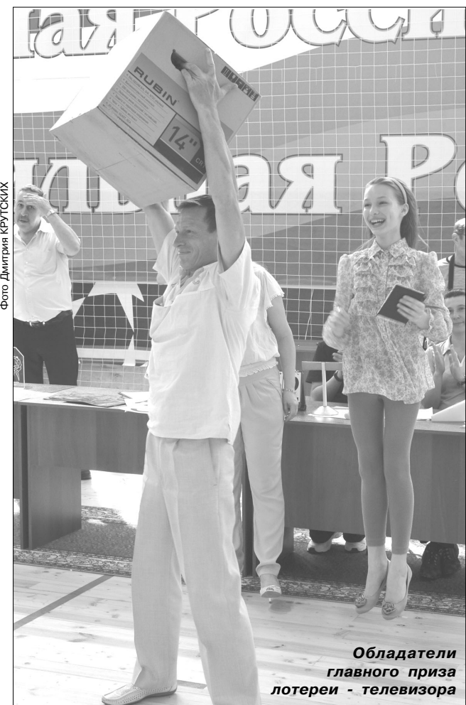
Обладатели главного приза лотереи - телевизора