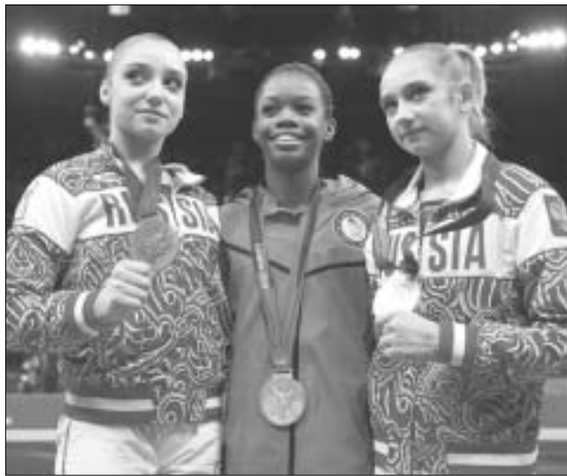
Трио лучших гимнасток Игр: Алия Мустафина, Габриэлла Дуглас и Виктория Комова (слева направо)

Виктория Комова уже считается лидером в мировой спортивной гимнастике, что она в очередной раз доказала на Олимпиаде в Лондоне.