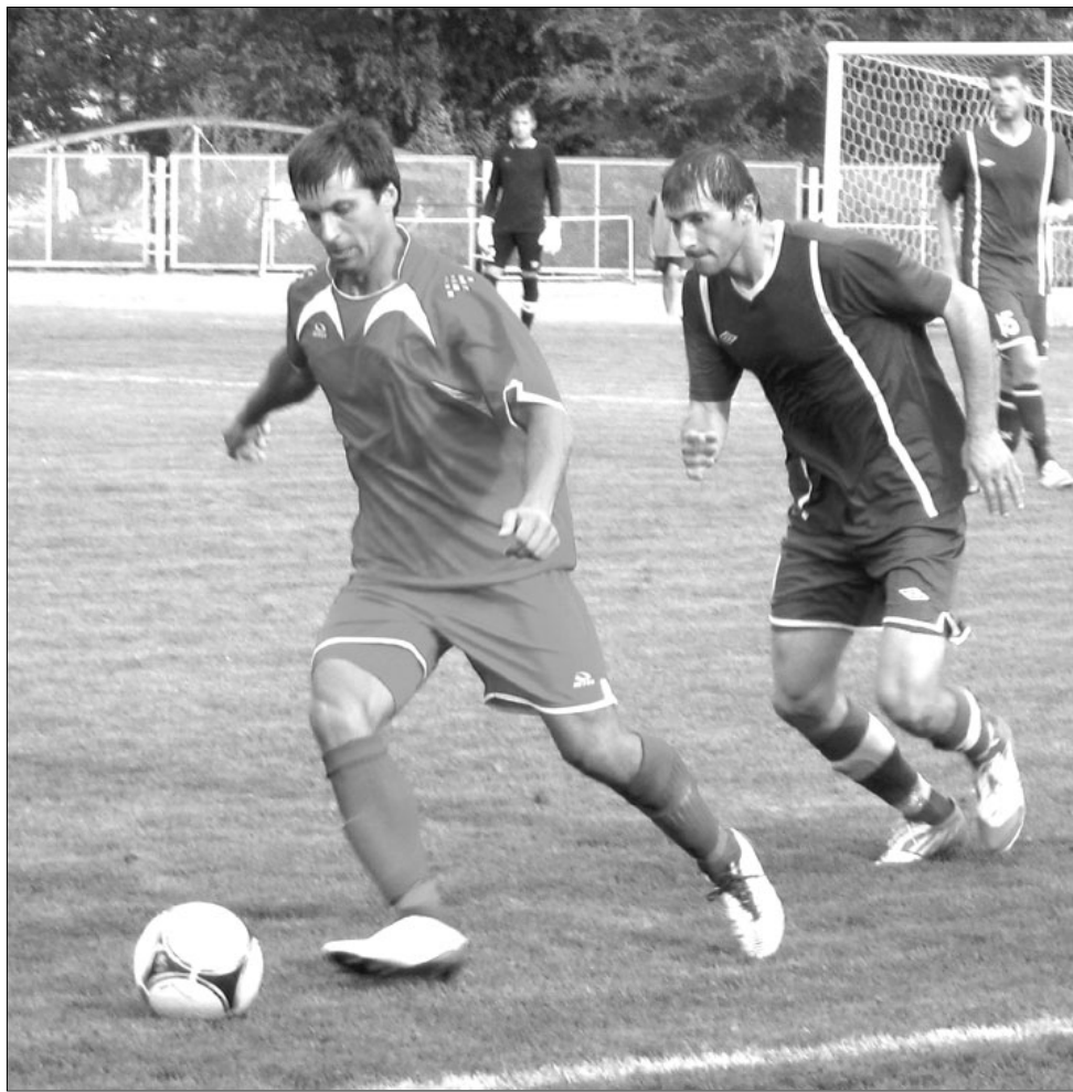
Догонят ли россошанские «химики» своих одноклубников из Новомосковска?