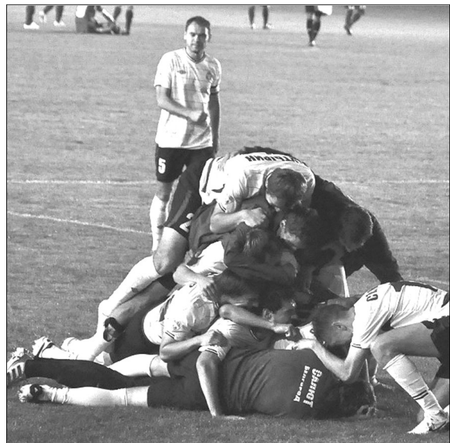
«Салют» празднует выход в 1/16 финала

В дополнительное время составы команд уравнились. Теперь уже Хорин за два предупреждения досрочно оказался вне игры. Воодушевленный «Салют» владел территорией, но воплотить свое преимущество в забитые мячи не сумел. «Губкин», разыграв мяч с центра, провел отчаянно-