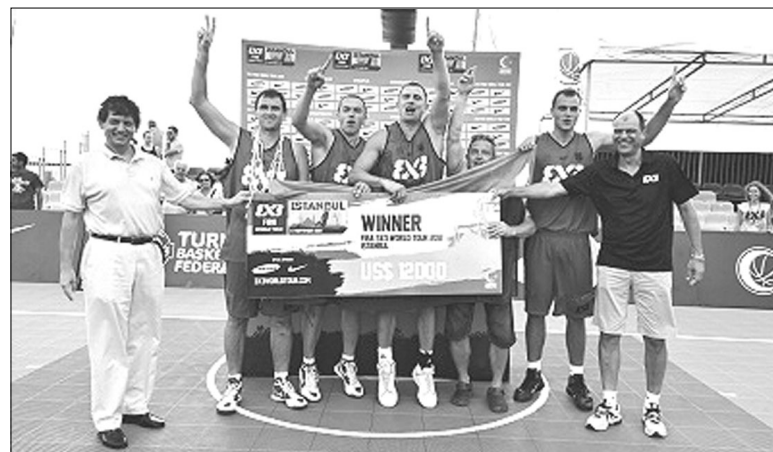
Путевка в Майями и 12000 долларов достались литовцам, выбившим в 1/4 финала из борьбы представителей Воронежа

и остальные встречи принесли нужный воронежцам результат.