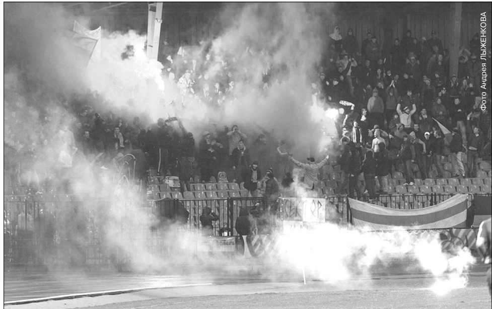
В Туле за свой «Арсенал» тоже болеют с огоньком, искры долетают даже до поля

Лискинский «Локомотив» в рейтинге штрафников расположился на привычном для себя десятом месте - напомним, что железнодорожники занимают такое же положение и в турнирной таблице первенства. Коллектив из Воронежской области стал единственным в