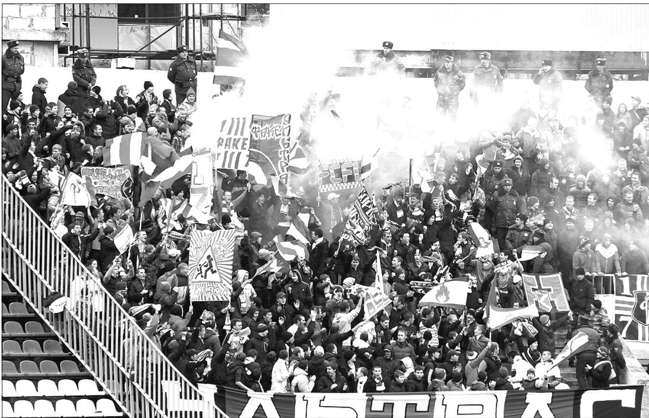
Фанатский сектор «Факела» в дыму, за его появление на трибунах клуб получает штрафы от КДК РФС

1 ноября. Скандирование зрителями ненормативной лексики и оскорбительных выражений, использование пиротехнических изделий на домашней игре с «Авангардом» - 14000 рублей.