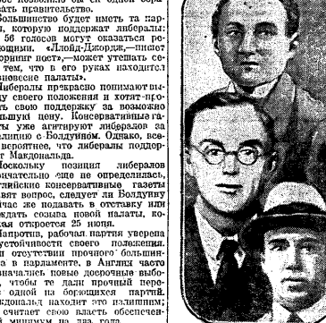
Макдональд (вверху) и Артур Харрис (в центре) и Гарри Шарп (внизу).

Воскресенье в Ленинградском районе колхозники работали в поле. Они собрали много урожая.