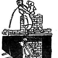
По кирпичику, но не быстро.