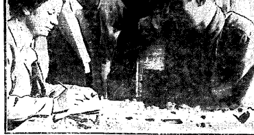
В близлежащих деревнях в Воронежской губернии для детей дошкольного возраста (от 6 лет до 8 лет) закупаются учебные группы работ на предприятиях. На снимке—представительница горбю райисполкома в сопровождении фабричного рабочего группы, тут же проделавшая задание.

Комиссия РПН, созданная для выявления и ликвидации безработицы, выявила в Варшаве 17 проц. лишенцев.