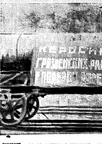
НА ШИПКЕ: один из эшелонов, прибывших в Воронеж в составе красного эшелона — поездок гражданские горючие топлива ЦЧО