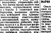
Свидетель Чумаков дал суд показания