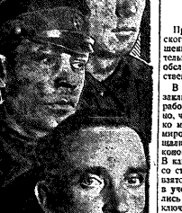
На днях исполнился 12-летний юбилей ИТД.

ОНИ НАРУШАЛИ ИСПРАВИТЕЛЬНО-ТРУДОВЫЕ И КАРЕЛЬНЫЕ НОРМЫ