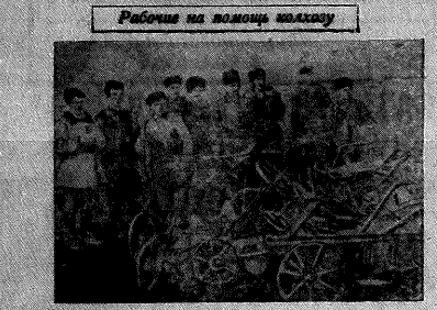
Работники на колхозном поле. Слева направо: директор колхоза, бригадир, бригадир, бригадир, бригадир.