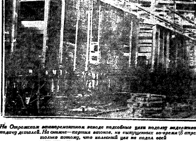
На откосах паровозостроительного завода подготавливают вагоны для поезда...