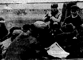
2-й областной отдел по развитию подсобных хозяйств колхозов в Омской области (Камышевский район, Камышевский колхоз)