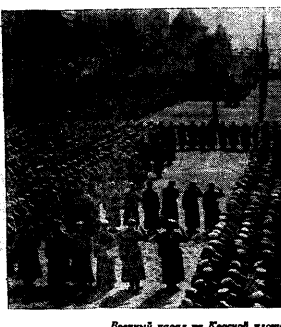
Великий парад на Красной площади