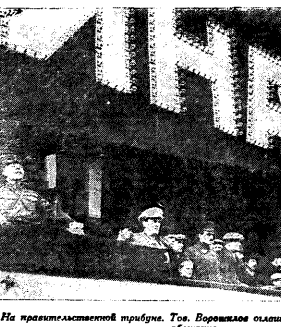
На Красной площади в Москве