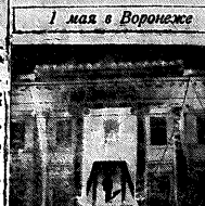
1 мая в Воронеже