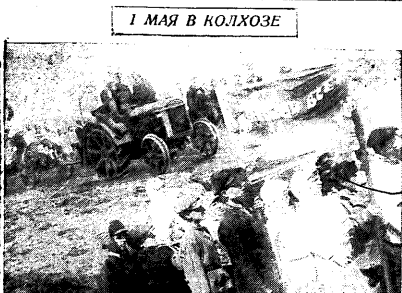
На снимке — работник колхоза «Красный маяк». Тракторист возделывает поля на сев Люцерны, Крестоцветных, а также люцерны, клевера.

Помощь единоличнику — это помощь колхозу. Чем больше колхоз помогает единоличнику, тем больше друзей у колхоза. Это является важным принципом работы по контрактиции.