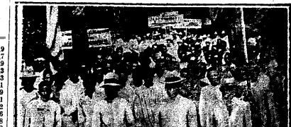
В колхозной школе на острове Ява, недавно состоялось молодежное антиимпериалистическое демонстрация — отклик на революционные события в Индии и в Китае. На сцене — общий вид демонстрации