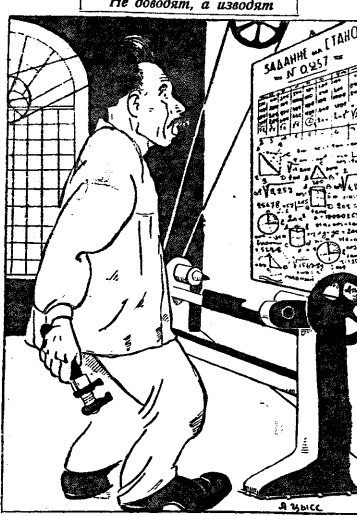
Не доводит, а изводит