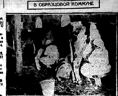
В колхозе им. Ленина, в Кирсановском районе, Тамбовского округа. На сцене — домашний доят коров

ИЗВЕЩЕНИЕ КОММУНАЛЬНОЕ ОТДЕЛЕНИЕ СЕР... (Public notice regarding municipal services)