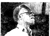
ДЛЯ КОССОН (вспомогательный) приветствует от имени рабочих всех профдвижений.