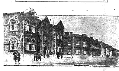
После завершения 1927 года полевых работ в Армении началось строительство жилищных домов. На фото: рабочие строят дома в Армавире и Делижане.