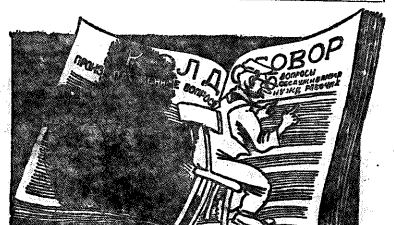
Многие партийные и профессиональные организаторы при сборе рабочих проделали «работы» производственных корпусов