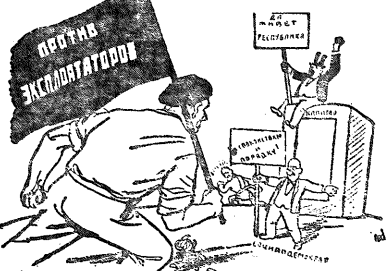
МОЩАМИ 1331 г. Пролетарат выступает. (Карикатура от «Рот фанк»)

БЕРЛИН. 29. — За последние дни на предприятиях Берлина созданы 130 первомуайских комитетов. Многие из них уже приступили к проведению 1 мая политических стачек. Центральный комитет ВЛКСМ в Берлине призывает рабочих к сплоченности и единству в борьбе против фашистского террора, образования единого фронта под руководством коммунистической партии. В ЛКСМ Берлина в Берлине созданы 130 первомуайских комитетов на заводах и фабриках. В связи с учащением предостережений рабочих Берлина от фашистского террора, стачки и забастовки являются не только средством борьбы с фашистским террором, но и средством сплочения рабочих и их представителей на предприятиях. Общее собрание революционных комитетов Берлина призывает рабочих к сплоченности и единству в борьбе против фашистского террора, образования единого фронта под руководством коммунистической партии. В ЛКСМ Берлина в Берлине созданы 130 первомуайских комитетов на заводах и фабриках. В связи с учащением предостережений рабочих Берлина от фашистского террора, стачки и забастовки являются не только средством борьбы с фашистским террором, но и средством сплочения рабочих и их представителей на предприятиях.