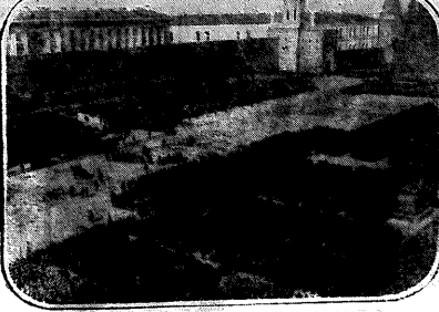
ПЕРВОЕ МАЯ В МОСКВЕ. Парад на Красной площади.

МАДРИД.—Вечерние (антифашистские) демонстрации в Мадриде накануне 1 мая были самыми массовыми в истории города. В них участвовало около 100 тысяч человек. Демонстрация началась в 19 часов у здания Конгресса. Впереди шествия шли коммунисты, за ними — рабочие различных предприятий. Демонстрация сопровождалась лозунгами: «Свобода, мир, социализм», «Свобода Испании», «Свобода Франции», «Свобода Италии», «Свобода Греции», «Свобода Китая», «Свобода Индии», «Свобода Японии», «Свобода Америки», «Свобода Австралии», «Свобода Африки», «Свобода Азии», «Свобода Европы», «Свобода Океании», «Свобода Антарктиды», «Свобода всей планеты».