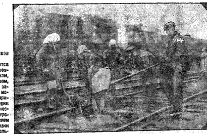
В осенне-зимний период. Ремонт и выверка путей на ст. Валуевки.

В августе месяц дорога перевозила 6 744 вагона, что составляет 42,1 процента от плана, а в сентябре — 4 002 вагона. Как же причина послужила основанием к невыполнению заданных планов по перевозке грузов? Главными причинами являются: загромождение путей, нарушение сроков доставки грузов, нарушение сроков доставки грузов.