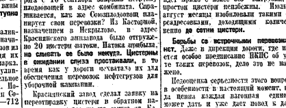
НЕДОГРУЗ ПРИНИМАЕТ ОГРОМНЫЕ РАЗМЕРЫ