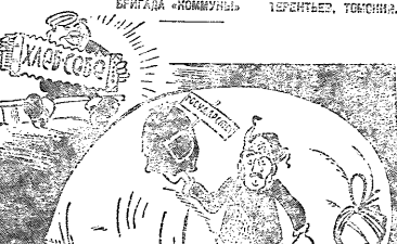
На мушкетер гарнизон.

В.ХАВА. — Баланшев — не исключение. В настоящее время в колхозах конопли используют только ручные инструменты. Однако в последние годы появились машины для обработки конопли, которые могут значительно повысить производительность труда. Эти машины должны быть широко распространены в колхозах. Необходимо также улучшить условия труда коноплильщиков. Для этого следует использовать все возможности механизации.