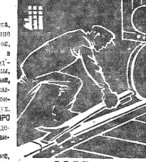
СВЕТ И ТЕНЬ

Что мешает нормальному работе станции? В основном — это нарушение маршрутизации. В основном — это нарушение маршрутизации. В основном — это нарушение маршрутизации.