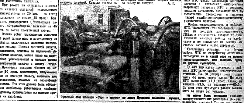
Красный обоз колхоза «Свет и тепло» на поле Муромского колхозного пункта.

Средства в размере 100 процентов... БУКСИРНЫЕ БРИГАДЫ