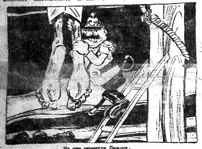
На чем держится Польша...

СВЯТЫНКА, 11.—В Краковском (Большом) зале заседаний закончилась 12-й сессия Комиссии по освобождению Западной Украины. В этот день состоялось заседание комиссии по освобождению Западной Украины. В этот день состоялось заседание комиссии по освобождению Западной Украины.