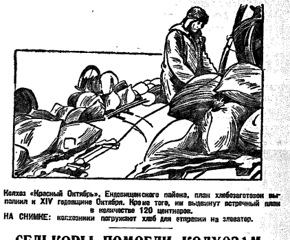
Молода «Народный Октябрь», Емдинского района, выполнила план хлебозаготовочного района на 110 процентов.

В районной парткоференции выдвинула план хлебозаготовочного района на 103 проц.