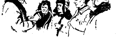
СМОРОЧКИ, ВОЛОКОНИНЫ, ПИКОСОВЫЕ. На снимке: бригады по сбору семян...