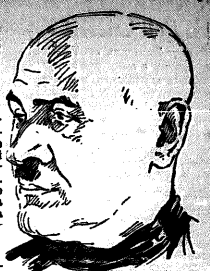
Помощник главного инженера цеха питания тов. Сталин (в центре), проверяющий работу бригады.

Эксплуатация цеха питания — это боевой участок борьбы за выполнение плана. Эксплуатация цеха питания — это боевой участок борьбы за выполнение плана. Эксплуатация цеха питания — это боевой участок борьбы за выполнение плана.