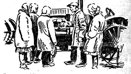
Национализация МТС позволила наладить тракторное. На снимке: коммунитария коммуны «Заря Свободы» занимается с трактором.