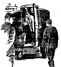
Возмездие лейбштюка суда. В тюрьме...