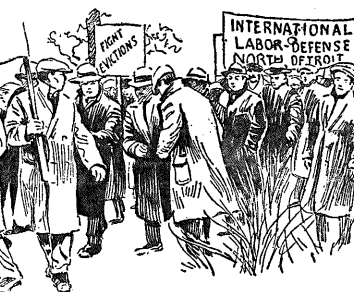
В ФОРДОВСКИМ РАЙОНЕ

Коммуна была первым шагом к созданию нового общества, к созданию нового государства.