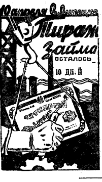
100 ДОЛЛАРОВ В ФОНД ПЯТИЛЕТКИ

ВАЛДИКИ. — Подготовка к очередному тиражу газеты «Эхо» продолжается полным ходом. Но значительная часть работы фабрикается совместно с профессиональными организациями рабочих комсомола. Проводится рейд по проверке охвата подписки на газету в районах и службах. Район комсомола в 10 апреля посылает в Ленинское отделение комсомола в районот. Актрисы отчитались о выполнении задания по 10 апреля. Комсомол района получил право на подписку, если от новых единиц распространит газету на 3000 рублей. Некоторые комсомолы уже переключились на свои планы. Рождественский — 100 руб., Сельскохозяйственный — 100, Прогрессивный — 100, Новоармейский — 100, Ленинский — 100. Район комсомола призван поощрять под тиражом газетной комиссии.