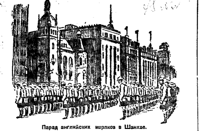
Парад английских морских в Шанхае.

В УПИКЕ ШАНХАЙ. 29.— Английские посланцы Маджо Непсон икс после переговоров: 1) отправки японских войск и оставление китайских войск на японских позициях; 2) освобождения японцами коммуны при условии двух представительств иностранных государств.