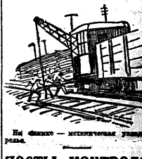
На станции — магистраль...