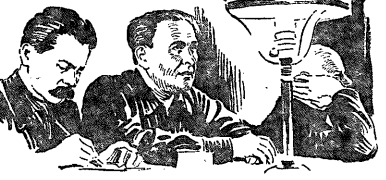
В ПРЕЗИДИУМЕ СЪЕЗДА