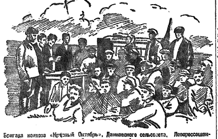
Бригада колхоза «Красный Октябрь», Ямбургского сельсовета, Ленинградского района, проводит уборку и поле.