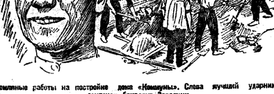
Земляные работы на постройке дома «Ильича». Слова лучшей ударницы бригады бригадир Завалин