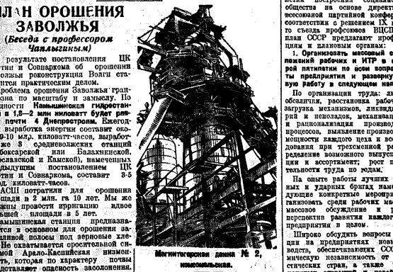
Матитогорская домна № 2, коммунистическая.

С фронта борьбы за промфилан. Это достижение является результатом активной работы коллектива завода.