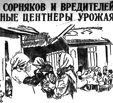
Детские игры в Ярославском агролесхозе.

Такого же мнения не разделяет районный комитет. Он в свое время шаровую для того, чтобы обеспечить своевременную шаровую шаровых в колхозах. А ведь он несет несомненно ответственность за колхозную работу.