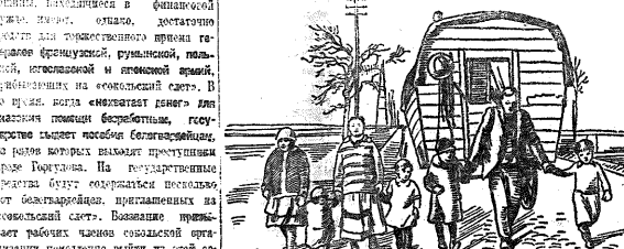
Семья безработных в Шпейере

Иногда мне кажется, что я вижу твою улыбку. Это слова, которые слышал я в Шпейере. Люди, которые раньше были работниками, теперь выжидают помощи. Они не могут найти работу, и их семьи голодают.