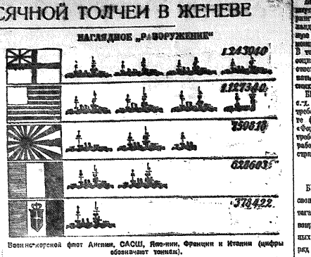
Венецианская фото Агитка, САСИ, Япония, Франция и Италия (фотография охватывает)

ЖЕНЕВА, 22. — Неожиданный успех коммунистической толчи в Женеве, которая в течение пяти месяцев провела в Женеве, — это, конечно, не только и не столько блестящая победа коммунистической толчи, сколько блестящая победа коммунистической партии в целом. Это блестящая победа коммунистической партии в целом, потому что коммунистическая партия в Женеве, как и во всем мире, является авангардом рабочего класса, и ее успехи являются успехами всего рабочего класса. Коммунистическая партия в Женеве, как и во всем мире, является авангардом рабочего класса, и ее успехи являются успехами всего рабочего класса.