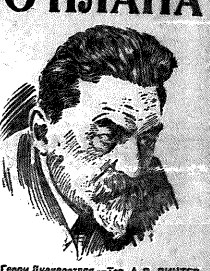
Горючий принимает и поощрению рабочему коллективу и руководящему составу Днепрострой в связи с успешным завершением великого исторического строительства.

Сегодня открывается величайшая в истории Днепровская гидроэлектростанция. Социалистический мир гордится этим великим достижением. Это — великая победа социализма, это — великая победа ленинского плана пятилетки.