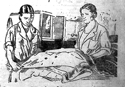
Вспарыватель швейной фабрики. Брикет принимает пропаривать.