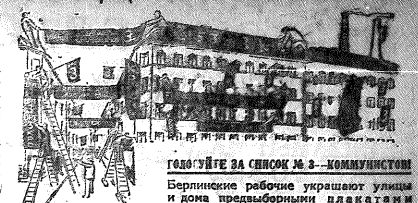
ТОВАРИЩИ ЗА РАБОТУ № 3 - КОММУНИСТЫ