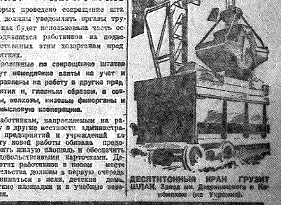
ДЕЯТЕЛЬНОСТЬ ИМАН ГРУММ ШИПАН. Запад им. Демидовского и Н.-Девичского (на Уралово).