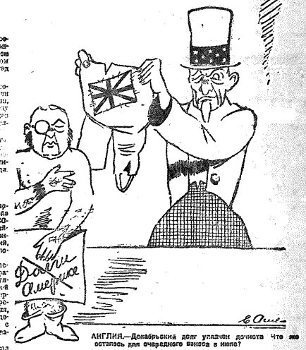
АНГИЛИИ — Десятилетия долг уплатили доиста. Что же осталось для очередного дня в плену?