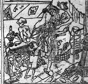
Государственный «издательский» оздоровления германских крестьян