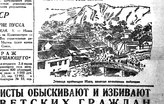
Танки провинции Иксэ, занятая японскими войсками

Шаж по профессору Штормовики. Шаж по профессору Штормовики. Шаж по профессору Штормовики.